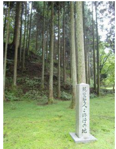
比叡山での修行の地

◆門徒さんから「寺報『響』の印刷料や送料はお支払しなくてもいいのでしょうか」とお手紙をいただきました。『響』の印刷料、送料はお布施から成り立っておりますので、支払はありません。また御懇志としてお送りして下さいました門徒さんのお名前は『響』にて記載させて頂いております。